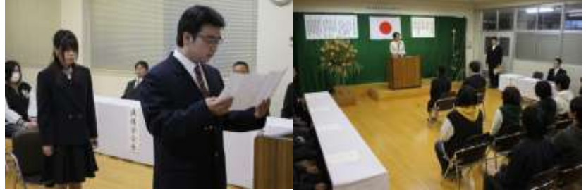
高校生活の抱負を述べる新入生

4月8日(水)始業式、4月9日(木)入学式が行なわれ、平成27年度の松山高校の学校生活がスタートしました。今年度の松山高校は、2名の新入生と2名の転編入生を迎えました。3月には、4名の卒業生を送り、寂しさもありましたが、元気づけたいの新生を迎え、これまで以上に松山高校を盛り上げていってくださると思います。 これからの4年間で友人や先輩と仲良く過ごし、多くのことを学びながら仕事やアルバイトにも励むことで、大きく成長できると思っています。 生徒18名、職員17名、合計35名の松山ファミリーです。